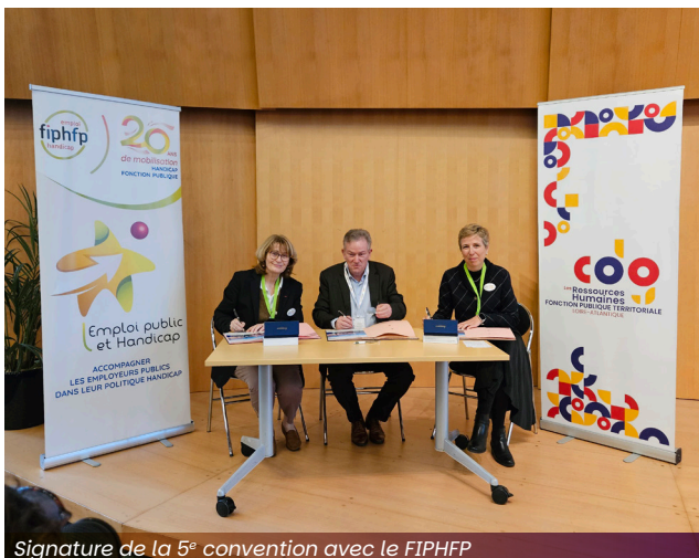
Signature de la 5 e convention avec le FIPHFP