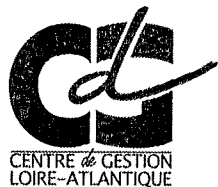
TABLEAU D'AVANCEMENT DE L'ANNEE 2022 AU GRADE DE REDACTEUR PRINCIPAL DE 1ERE CLASSE