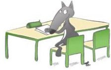
En m'asseyant, j'évite de faire du bruit avec les chaises