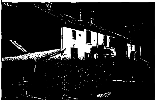
Argentière-La-Bessée (Hautes-Alpes) a acheté des pavillons de l'usine Pechiney, pour les louer.

« Il faut faire évoluer le produit (illuminations, thématiques) tous les trois ans, précise Maude Haglon, assistante technique au PAT. En 2001-2002, l'illumination de dix-sept nouveaux sites représente un investissement total de 565000 euros hors taxes, financé par des fonds européens, le conseil général du Calvados, le syndicat départemental d'électricité et d'équipement et les communes. Les trois premières années, les circuits ont attiré 90% de la population locale. Puis la fréquentation s'est élargie au public de proximité et aux touristes. »